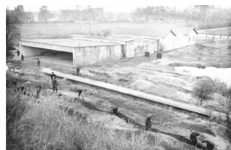
Le chantier de fouilles du charnier de La Doua sur le stand de tir à 50m, le 10 novembre 1944.