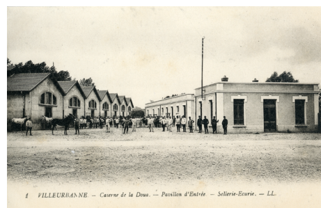
Carte postale de la caserne de La Doua, 1916.