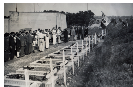
Cérémonie à La Doua, 1947.