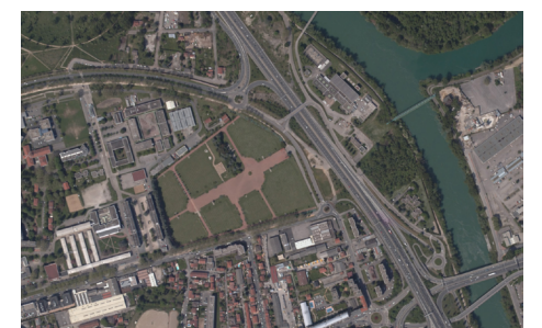
Photographie aérienne de La Doua en 2008.