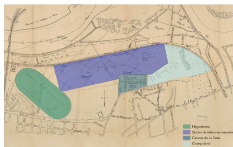
Plan des terrains du « grand camp » autour de 1935.